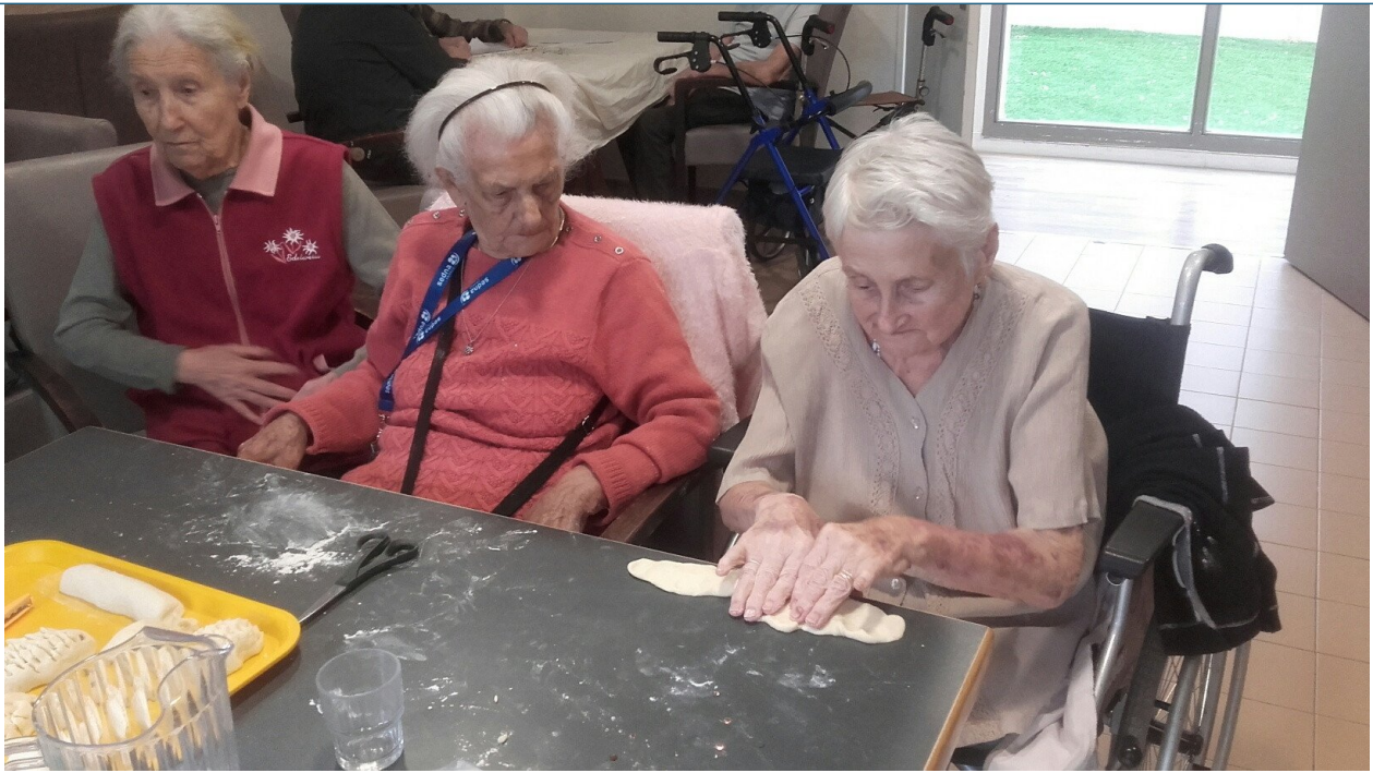
Ou des envies.