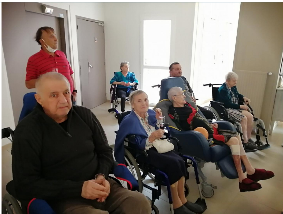
et un beau moment de convivialité pour les résidents.