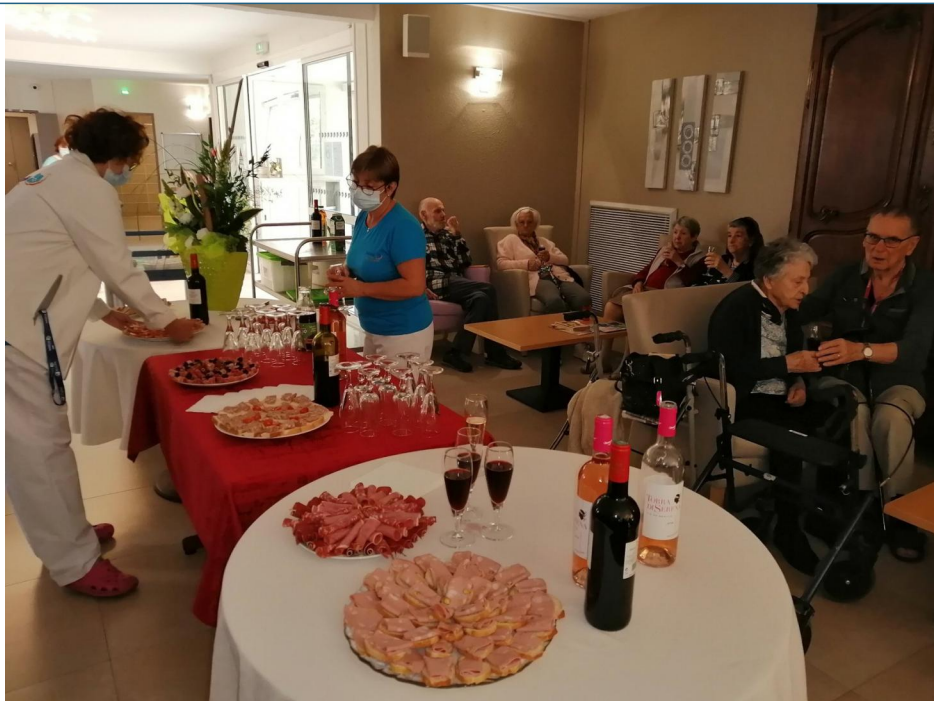
Un vrai régal pour les papilles