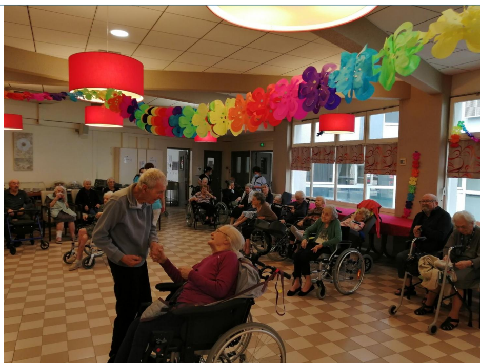
Ces dames sont ravies car les Messieurs sont fort galants et charmants. Une petite danse chère Madame ?