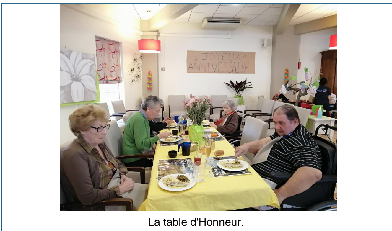
La table d'Honneur.

Nous étions encore dans l'ambiance de la semaine des vendanges quand nous avons fêté les anniversaires du mois de septembre.