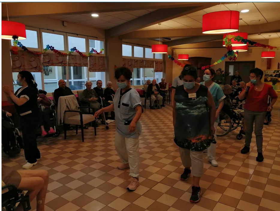
Et pour finir, un petit madisson !