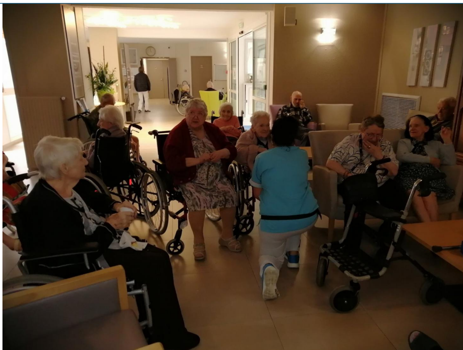
Un beau moment de partage et d'accueil.