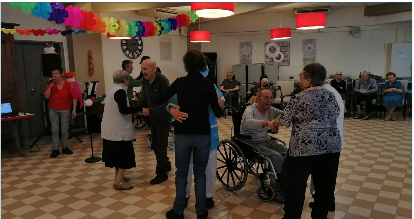
Mais les amateurs de danse nous ont vite rejoints.