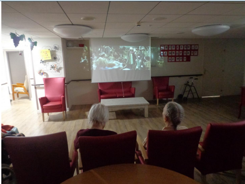
Un film sur grand écran. Ce jour là, c'était séance de cinéma, parfois propice à l'endormissement.