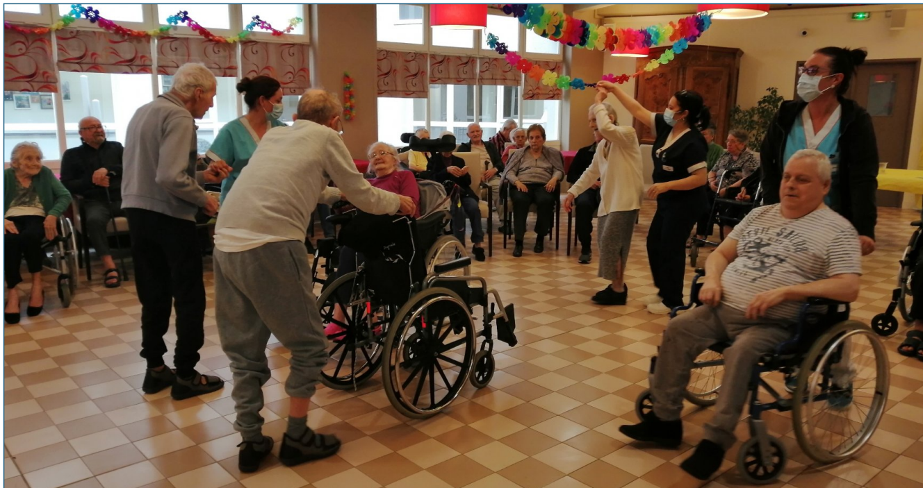
Tous en piste...