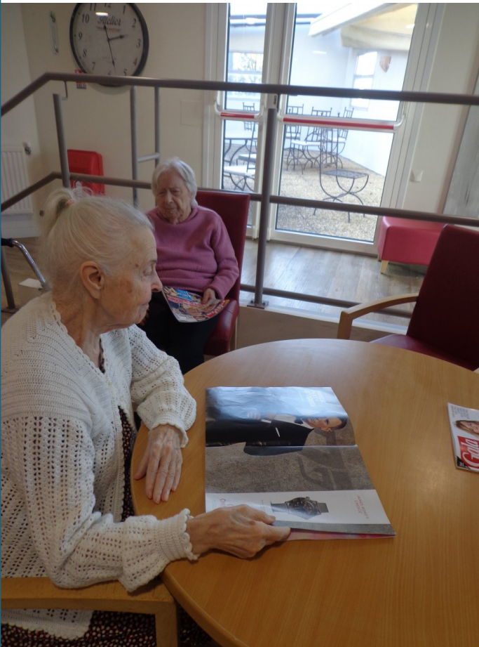
Plaisir de feuilleter une revue.