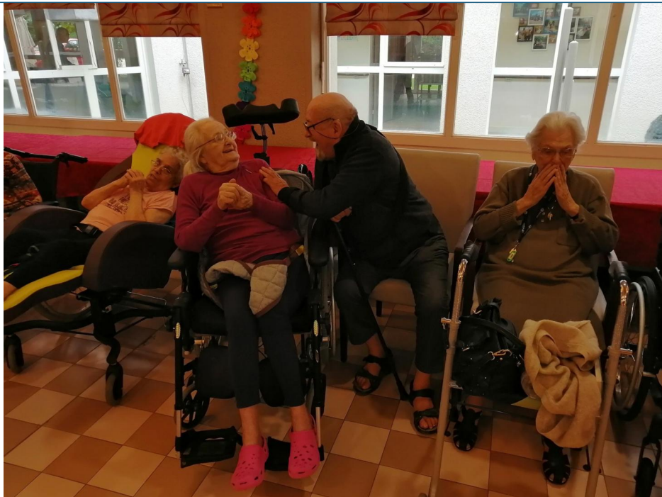
Et quand on ne danse pas, on rit d'une petite anecdote que l'on partage.