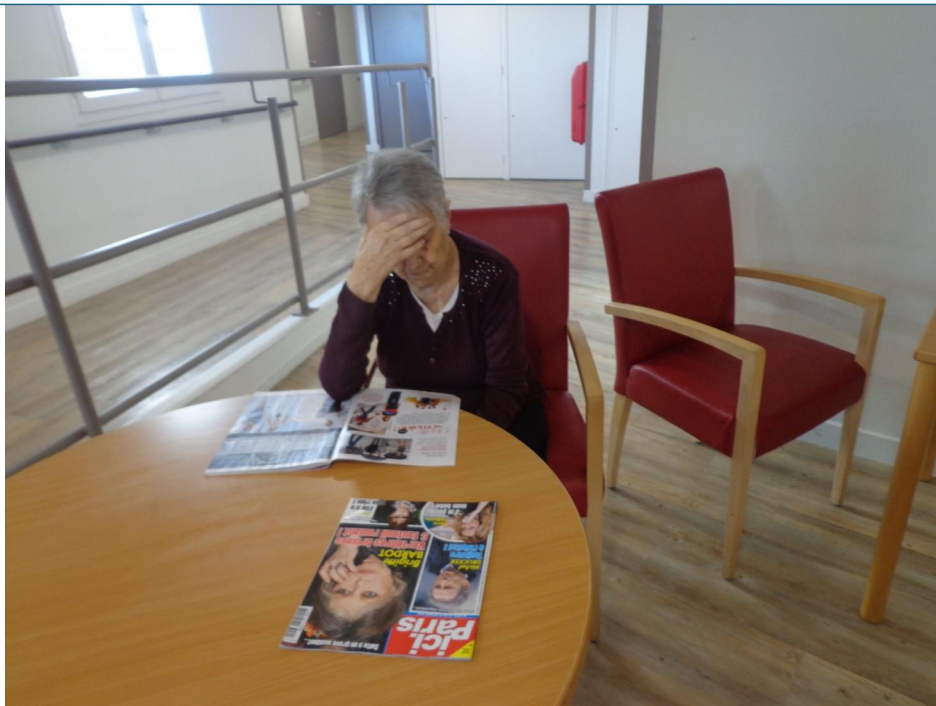
Ou de se "plonger" dans la lecture d'un article.