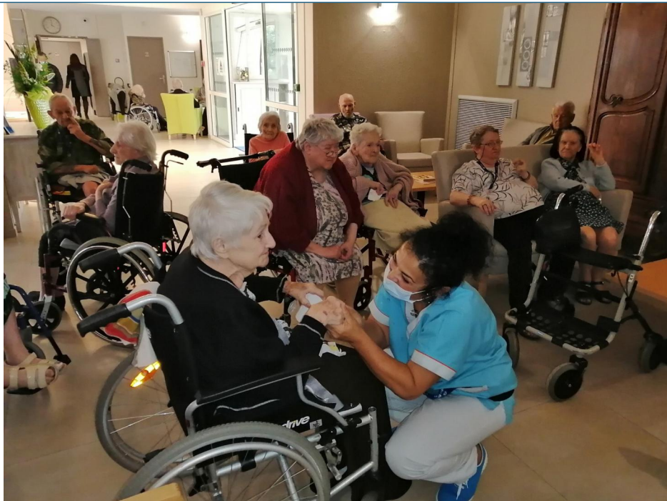
La musique ravit le coeur de tous et les sourires se dessinent.