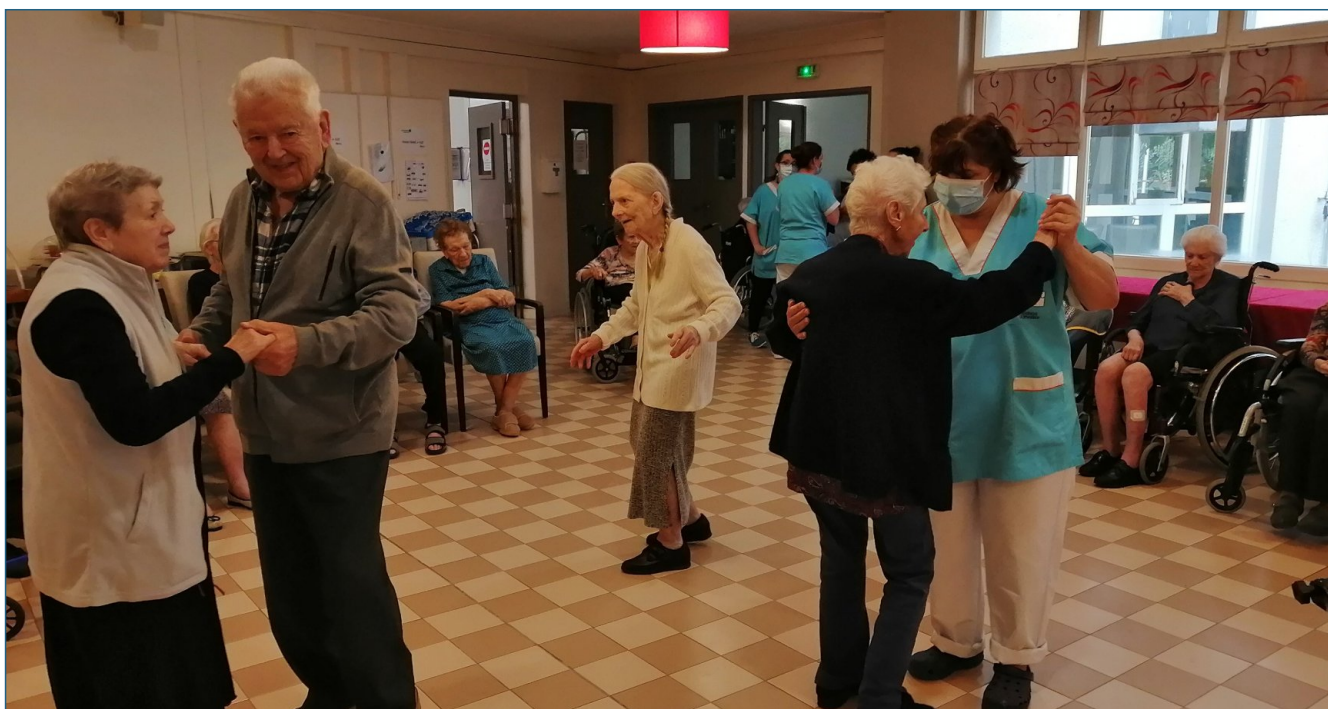
Une petite valse...