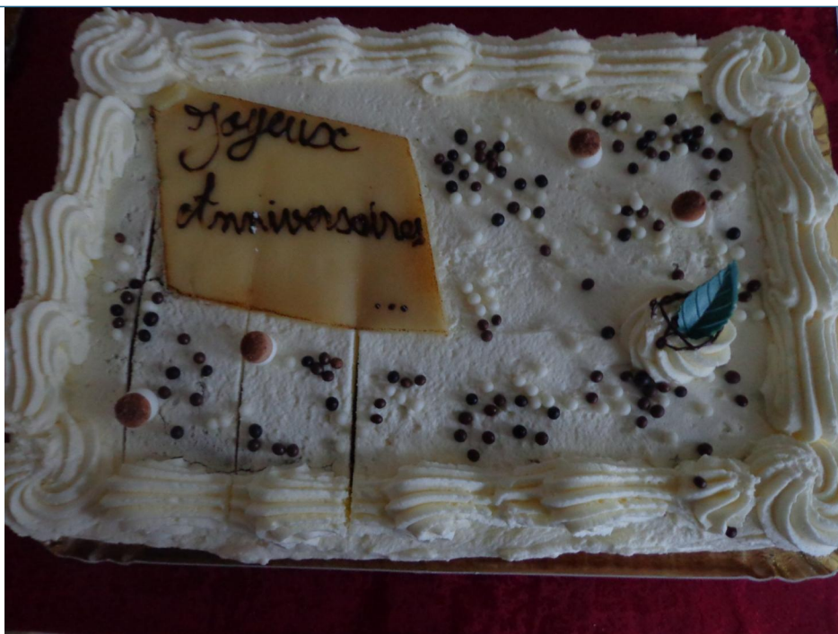
Les résidents ont apprécié les gâteaux d'anniversaire.