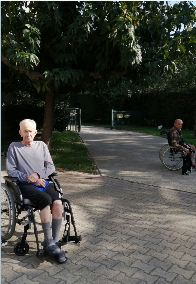
Monsieur Gras qui a fêté ses 88 ans.