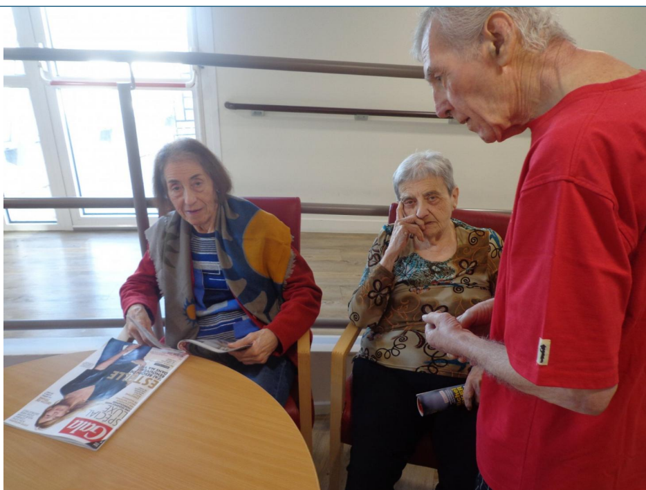
Atelier lecture de magazines.