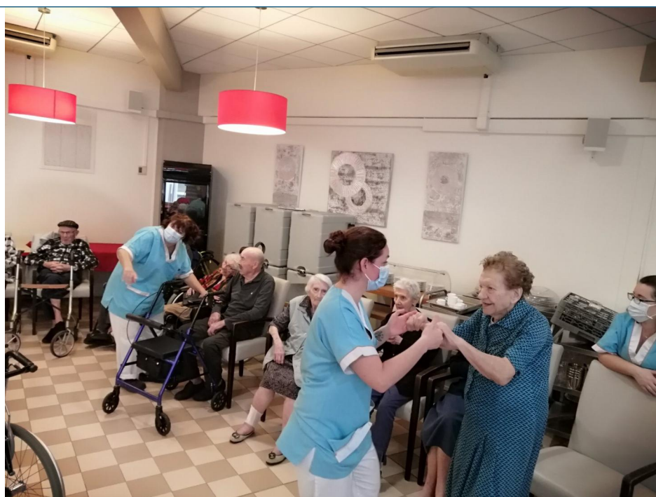
Trois petites notes de musique...