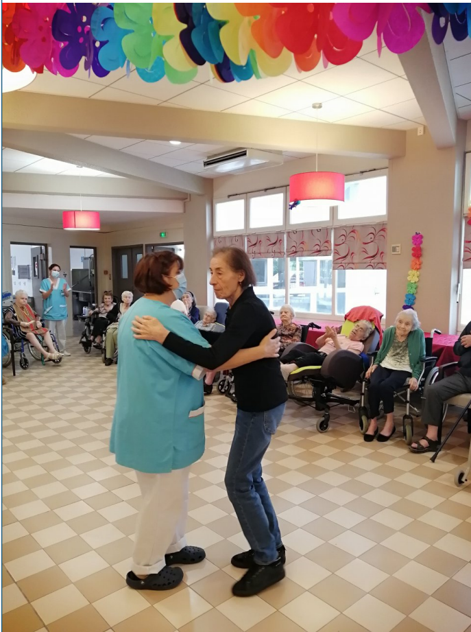
Deux dames pour ouvrir le bal.